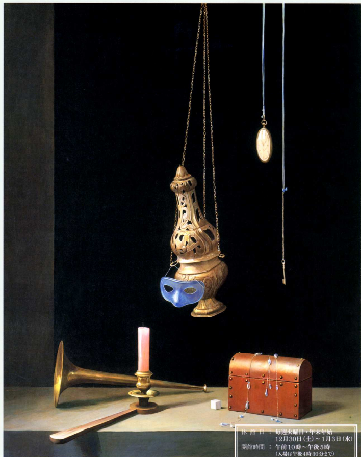
展示「静物」より 岩田榮吉《香炉と宝石箱》1977年 油彩/キャンバス