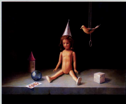
展示「人形」より 岩田榮吉《人形と鳥》1970年 油彩/キャンバス

横浜本牧絵画館の開館記念展示として開催した「岩田榮吉の世界 I」に引き続き、このたびその続編にあたる「岩田榮吉の世界 II」を開催いたします。