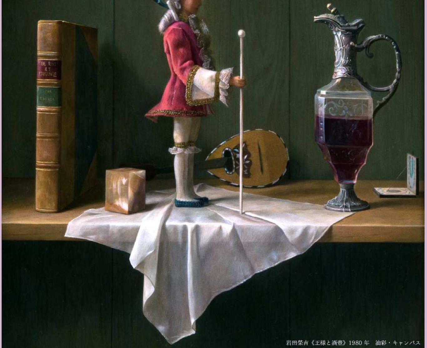
岩田榮吉《王様と酒壺》1980年 油彩・キャンバス