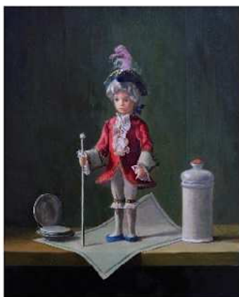
岩田榮吉《王様と時計》油彩・キャンバス

当館では、様々な角度から「岩田榮吉の世界」をご紹介してまいりましたが、このたびは作品における「モチーフの追求」を取上げます。