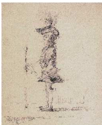
岩田榮吉《公爵 下絵》鉛筆・紙